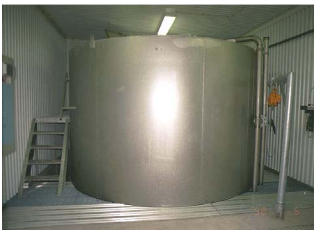
Gunneruds biobädd, byggd i rostfritt stål SS2333.