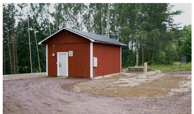
Överbyggnad i Gunneruds avloppsreningsverk med slamavskiljaren, som är tillverkad av glasfiberarmerad plast, placerad till höger.