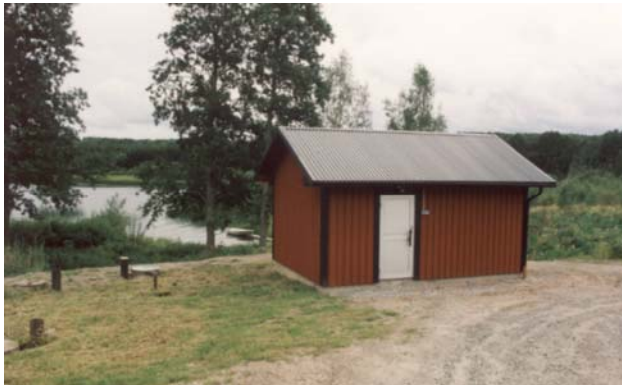
Överbyggnaden till Bergs reningsverk. Slamavskiljaren (av betong) som vid leveransen var en befintlig, är placerad till vänster.

Båda dessa anläggningar är projekterade och byggda som totalentreprenad av Emendo AB.