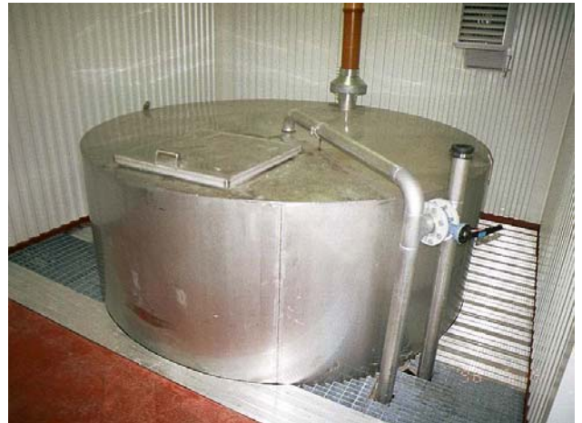
Biobädden i Bergs avloppsreningsverk, byggd i rostfritt stål SS 2333.