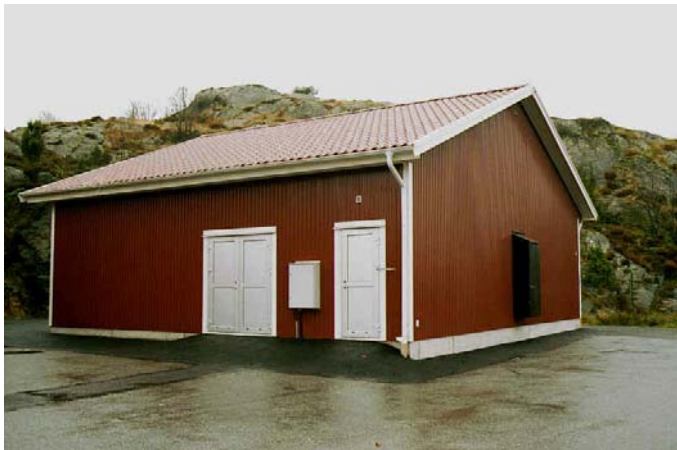
Överbyggnaden till Sunna - Kyrkesund avloppsreningsverk

Anläggningen är projekterad och byggd på totalentreprenad av Emendo.