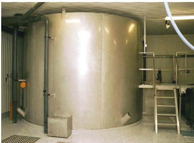
Biobädden, byggd i rostfritt stål SS2333.