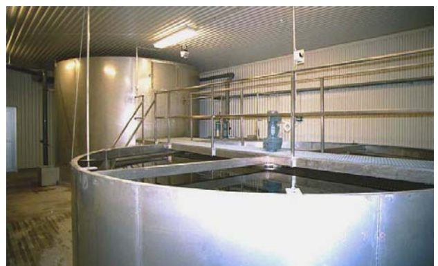
Sedimenteringsbassängen med biobädden längst bort. Hela bassängen är tillverkad i rostfritt stål SS2333.