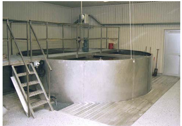
Vy över sedimenteringsbassängen visar lättåtkomligheten. Fri passage runt hela bassängen.